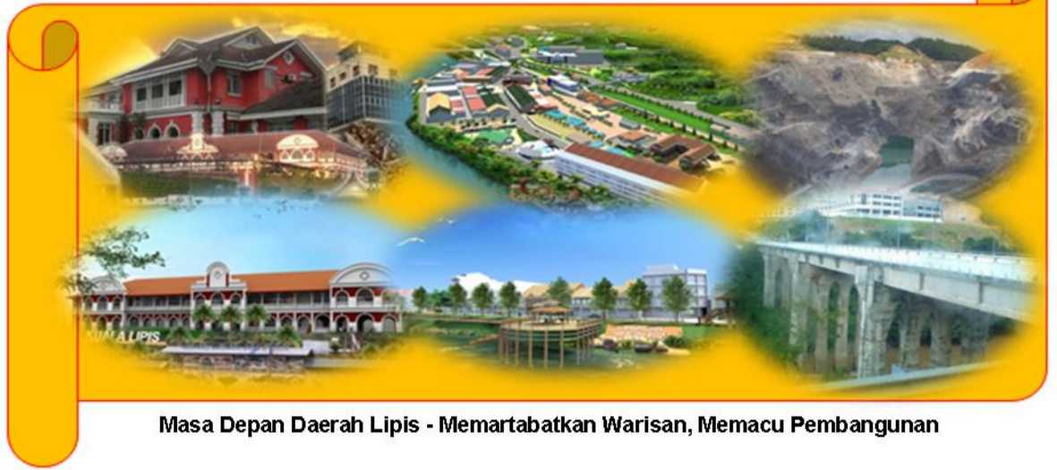
Masa Depan Daerah Lipis - Memartabatkan Warisan, Memacu Pembangunan

“KALAU ORANG TIDAK TAHU SEJARAH, IA TIDAK AKAN FAHAM MASA KINI, APALAGI MASA DEPAN. SEMUA KESALAHAN YANG KITA LAKUKAN SELAMA INI TERJADI KERANA KITA TIDAK TAHU SEJARAH” - PRAMOEDYA ANANTA TOER.