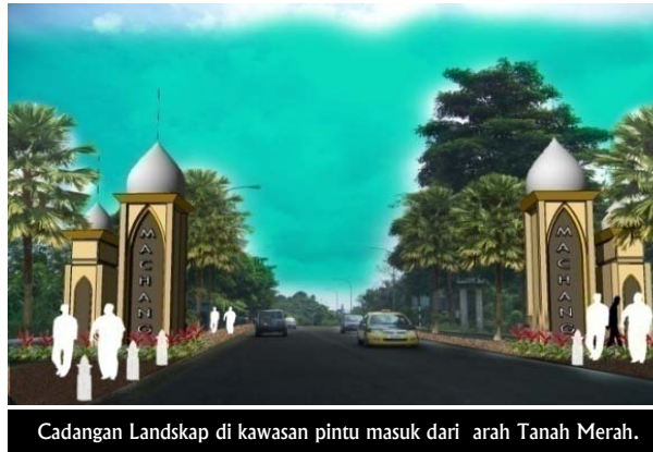
Cadangan Landskap di kawasan pintu masuk dari arah Tanah Merah.

Yang Dipertua Majlis Daerah Machang Jalan Tok Kemuning 18500 Machang Tel : 09- 9751076 Fax : 09- 9751431 Email : mdm@kelantan.gov.my