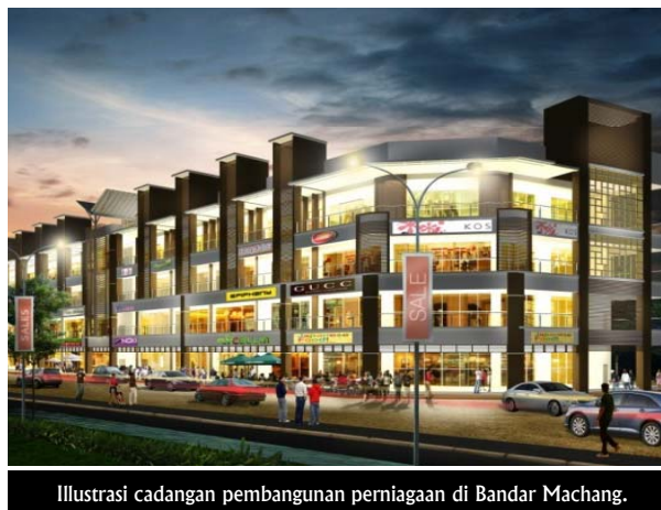
Ilustrasi cadangan pembangunan perniagaan di Bandar Machang.